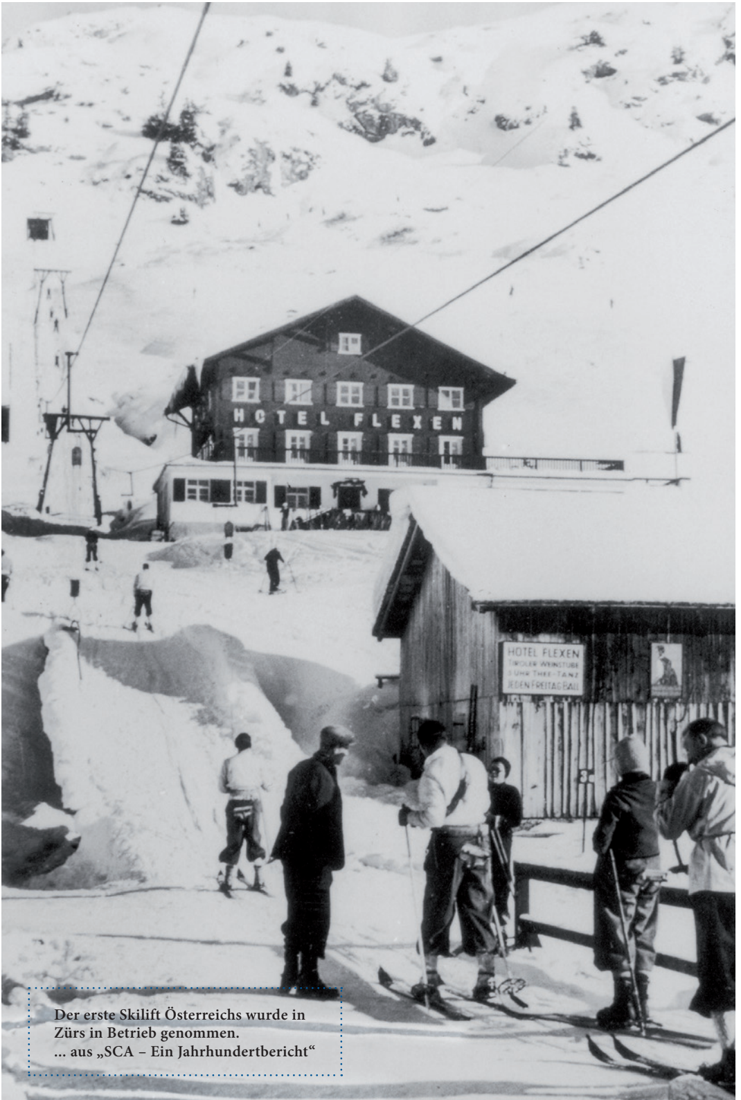
Der erste Skilift Österreichs wurde in Zürs in Betrieb genommen. ... aus „SCA – Ein Jahrhundertbericht“