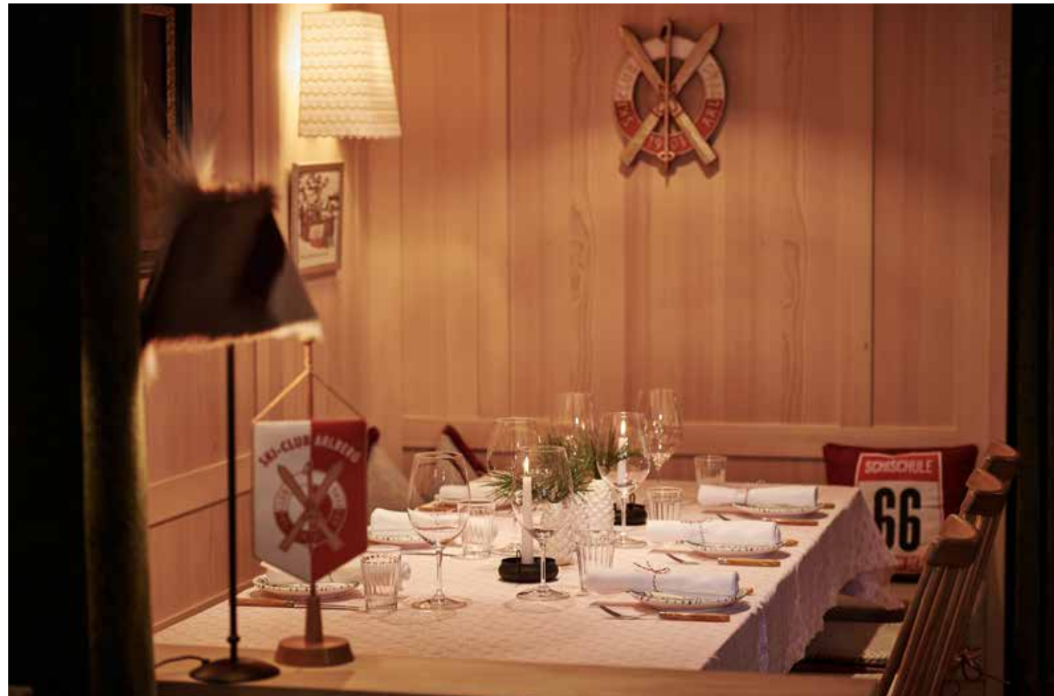
(Above) Schmelzhof and the legendary Arlberg Ski Club are closely connected. (Below) Enjoy some rest and relaxation in the new Schmelzhof Spa, with a Finnish sauna, sanarium, saltwater steam bath, infrared light therapy and quiet rooms.

Der Schmelzhof und der legendäre Ski-Club Arlberg sind eng miteinander verbunden (oben). Unten: Eintauchen in eine Wohlfühloase: Der neu gestaltete Schmelzhof Spa wartet auf mit finnischer Sauna, Sanarium, Sole-Dampfbad, Infrarotkabine und Ruheräumen.