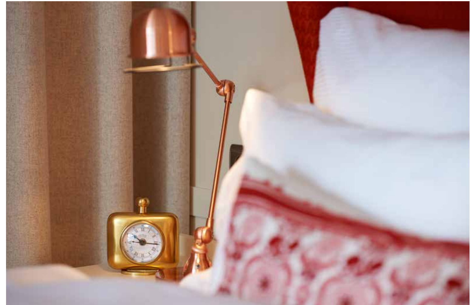
Schmelzhof's interior is packed with charming details, making it an extraordinary place, be it in the individually designed rooms and suites (above) or the new spa (below).

Das Interieur mit seinen vielen stilvollen Details macht den Schmelzhof zu einem ganz besonderen Ort, sei es in den individuell eingerichteten Zimmern und Suiten (oben) oder im neuen Spa (unten).